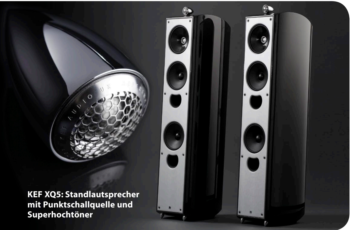
KEF XQ5: Standlautsprecher mit Punktschallquelle und Superhochtöner