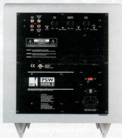
Satte 100 Watt Leistung sorgen für ordentlich Druck im Frequenzkeller. Bemerkenswert ist die Präzision, mit der KEFs PSW 1000.2 auch Musik wiedergibt