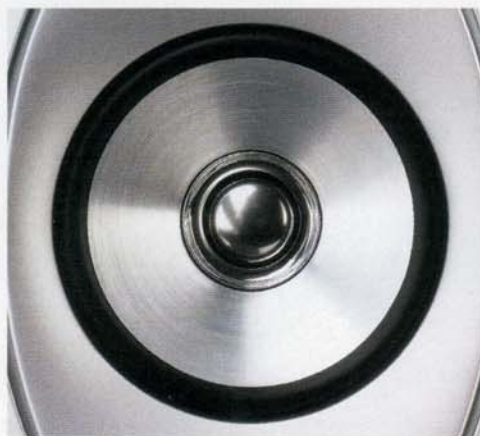
Im Zentrum des Konusmitteltöners liegt die 15-Millimeter-Hochtonkalotte

Angesteuert vom hervorragenden Denon-Receiver AVR-1803 zeigte das englische Ensemble gleich, wo es langgeht. Joe Satrianis Finger laufen leicht und locker über den Gitarrenhals und so hört es sich auch an, präzise, impulsiv und glasklar. Der treibenden Rhythmusfraktion kommt der Subwoofer zugute, satt und tief sind die Bassdrum-Hiebe. Bei der fantastisch klingenden Ambra gefällt das ausgezeichnete Zusammenspiel der fünf Satelliten. Diese sind eben nicht nur technisch aus einem Guss, sondern spielen auch so.