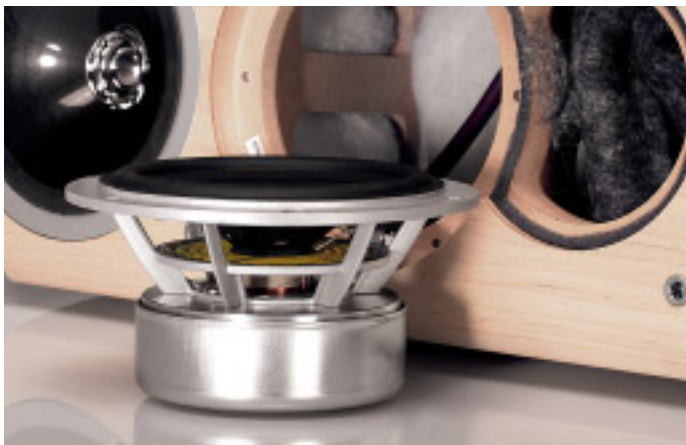
Top-Basswiedergabe dank fettem Antrieb und vorbildlicher Membranentlüftung

in den Basskeller hinunterzusteigen, gleichzeitig aber erst bei derer 400 an den Mitteltöner zu übergeben – was diesen zwar ungemain entlastet und so den Einsatz der neuartigen Flachsicke ermöglicht, dem Wofer allerdings einiges an Verzerrungsarmut abfordert. Deshalb kommt hier ein „Ultra Low Distortion Motor System“ getaufter Antrieb zum Einsatz, bei dem durch gezielte Eingriffe wie etwa die Anbringung so ge-