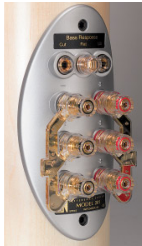
Die Blechbrücken dürfen gerne durch Kabelstücke ersetzt werden

passenden silber eloxierten – und leider getrennt zu erwerbenden – Aluminiumständern Platz, während vergoldete und isolierte Blechbrücken den Betrieb an nur einem Kabelstrang ermöglichen. Die Einspielzeit ist überstanden, und es fällt auf – dass nichts mehr auffällt. Aus vier mach eins: Papier, Polypropylen und zweimal Titan sprechen mit einer Stimme. Der Bass, der bei der ersten Inbetriebnahme noch durch Abwesenheit glänzte und demzufolge mittels der Anpassungsstecker einen sanften Motivationsschub erhielt, tut nun eindeutig des Guten zu viel und wird deshalb wieder in „flat“-Stellung gezügelt. So kann er sich mit einer unglaublich durchsichtigen und klaren Wiedergabe tieffrequenter Strukturen profilieren – daran dürfte auch die offensichtlich mit viel Fingerspitzengefühl abgestimmte Unterstützung durch das opulent bemessene, strömungsgünstig sich