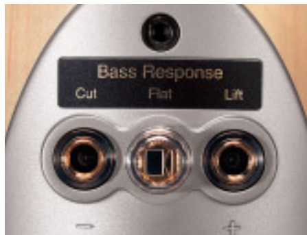
Die Bassanpassung heißt bei KEF offiziell „Boundary Control Device“

passenden silber eloxierten – und leider getrennt zu erwerbenden – Aluminiumständern Platz, während vergoldete und isolierte Blechbrücken den Betrieb an nur einem Kabelstrang ermöglichen. Die Einspielzeit ist überstanden, und es fällt auf – dass nichts mehr auffällt. Aus vier mach eins: Papier, Polypropylen und zweimal Titan sprechen mit einer Stimme. Der Bass, der bei der ersten Inbetriebnahme noch durch Abwesenheit glänzte und demzufolge mittels der Anpassungsstecker einen sanften Motivationsschub erhielt, tut nun eindeutig des Guten zu viel und wird deshalb wieder in „flat“-Stellung gezügelt. So kann er sich mit einer unglaublich durchsichtigen und klaren Wiedergabe tieffrequenter Strukturen profilieren – daran dürfte auch die offensichtlich mit viel Fingerspitzengefühl abgestimmte Unterstützung durch das opulent bemessene, strömungsgünstig sich